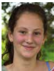
Jeanne Andries Ecole Decroly (Uccle)